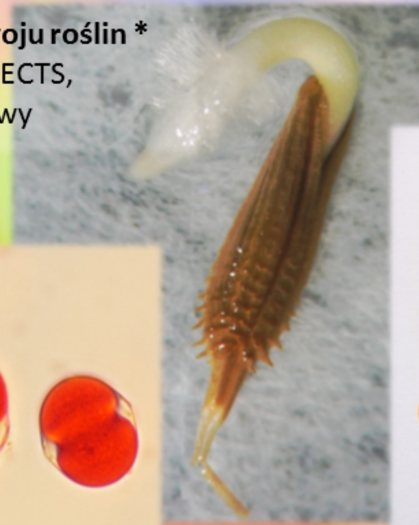
Biologia rozwoju roślin * WBNZ-966, 3 ECTS, semestr zimowy