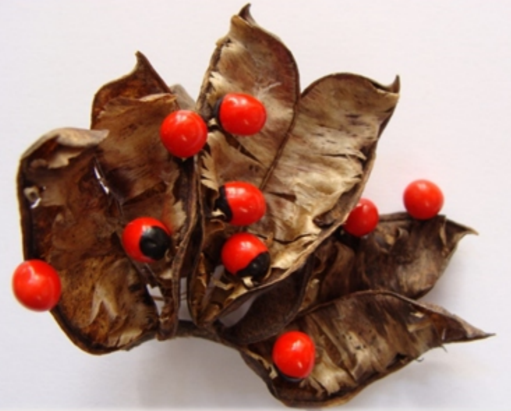
Biologia owoców i nasion WBNZ-41, 1 ECTS, semestr zimowy

Wiedza i umiejętności zdobyte na kursach przydatne w pracy w instytucjach i firmach zajmujących się: tradycyjną uprawą roślin, biotechnologią roślin, edukacją szkolną